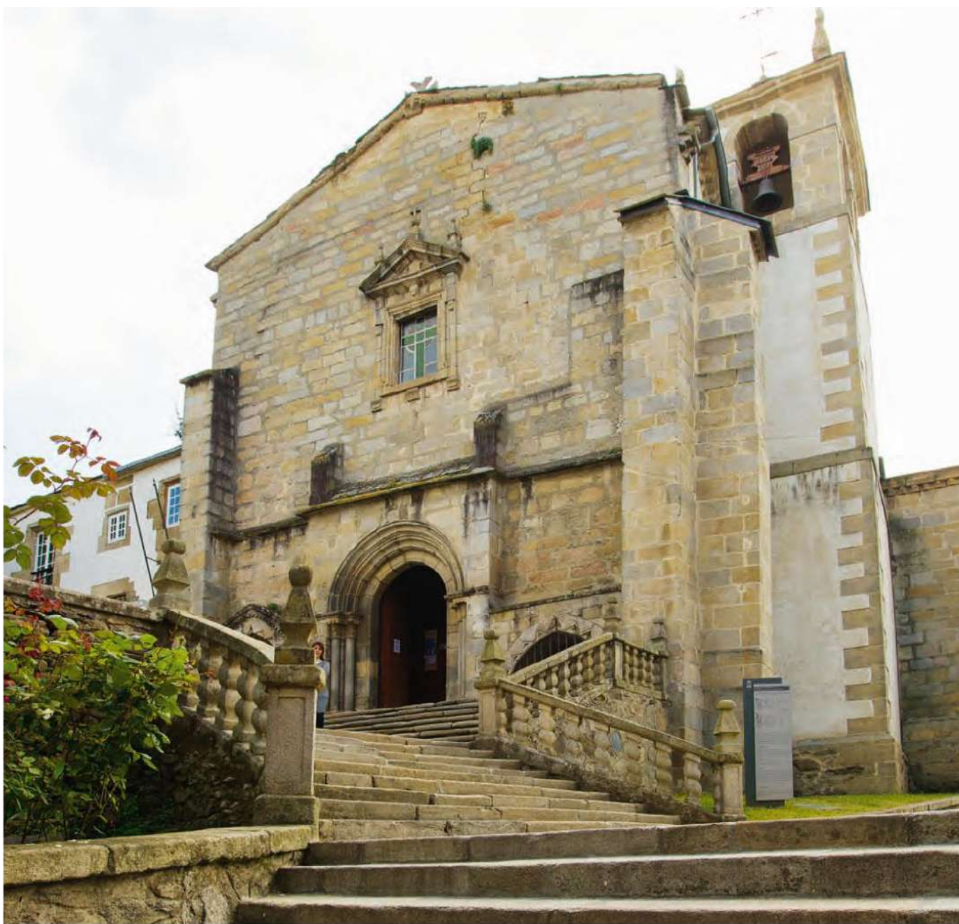
Mosteiro de San Francisco

oxival e con detalles románicos, planta de cruz latina na que a nave principal foi reconstruída no ano 1657 polo mestre Diego Ibáñez Pacheco, o mesmo arquitecto que levanta o claustro da catedral mindoniense. No ano 1809 as tropas invasoras francesas convérteno en cuartel e cuadras de cabalos, posteriormente queimárono como represalia e no ano 1842 a Xunta Superior de Bens Nacionais acabará por ceder as instalacións monásticas ao Concello e convertendo a súa igrexa en parroquial.