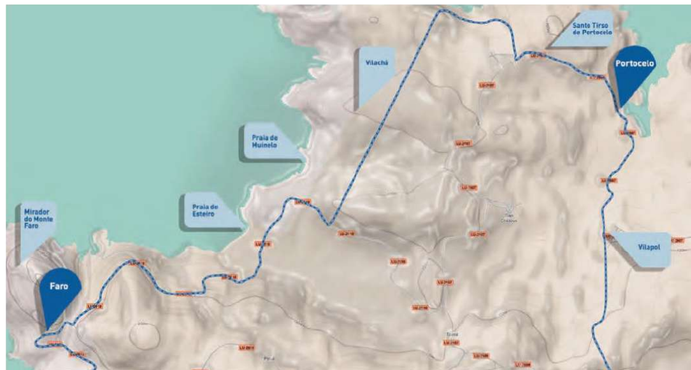
▲ Mapa trazado Portocelo-Faro

Seguimos na LU-2610, pasamos o punto quilométrico 5 para comezar a descender. Nese mesmo intre observamos a igrexa de Faro á nosa dereita. Un quilómetro despois estamos en Reboredo, onde recomendamos visita-las escavacións arqueolóxicas da vila medieval de Area e o seu areal. (23.8 km dende o Cruceiro de Cervo)