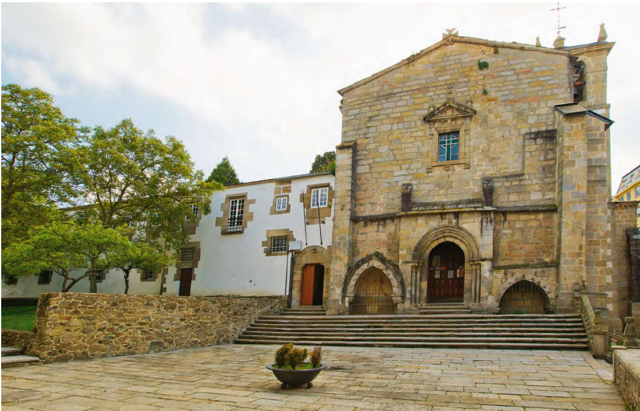
Santa María, San Francisco de Viveiro