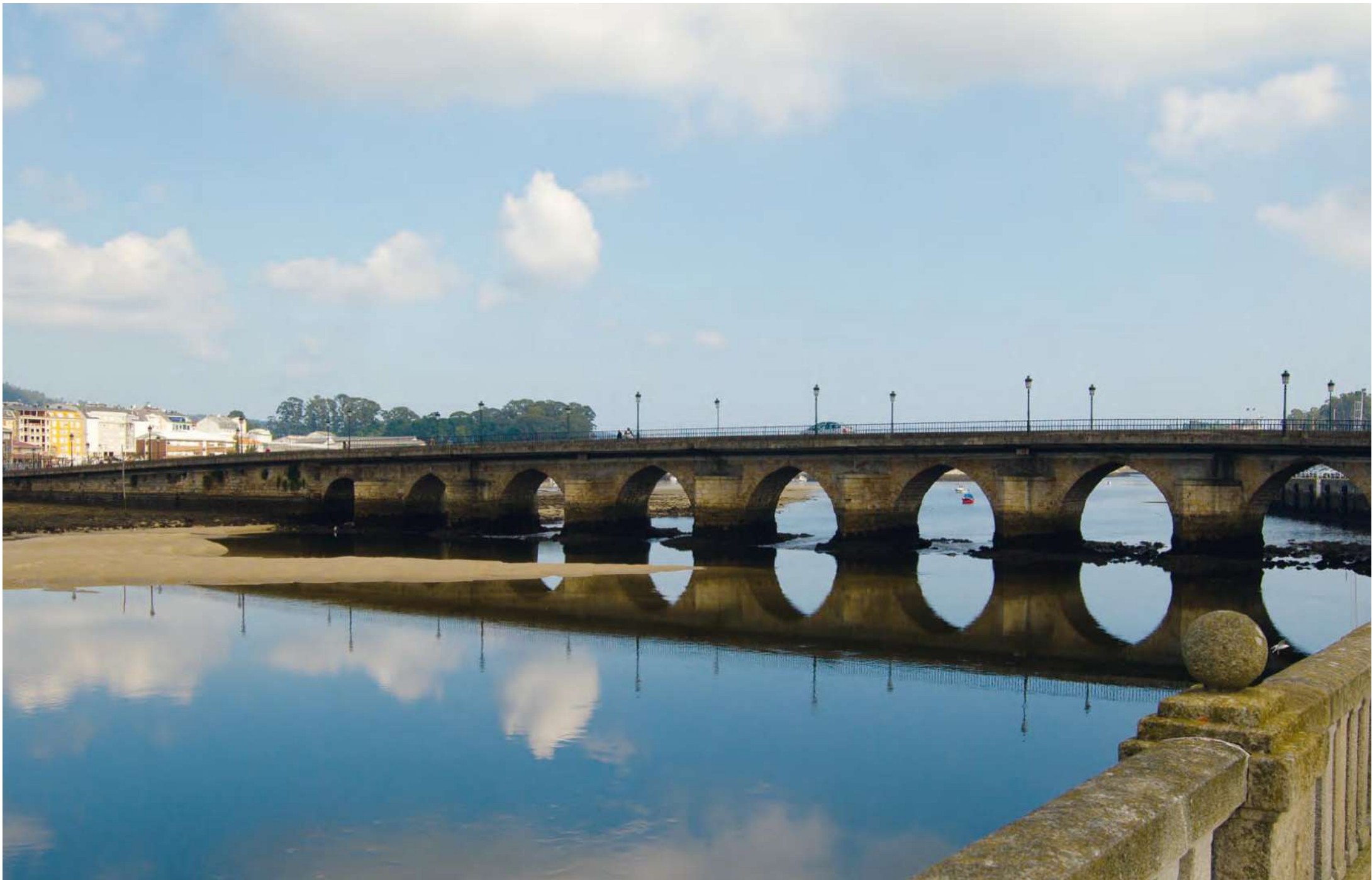
Ponte da Misericórdia