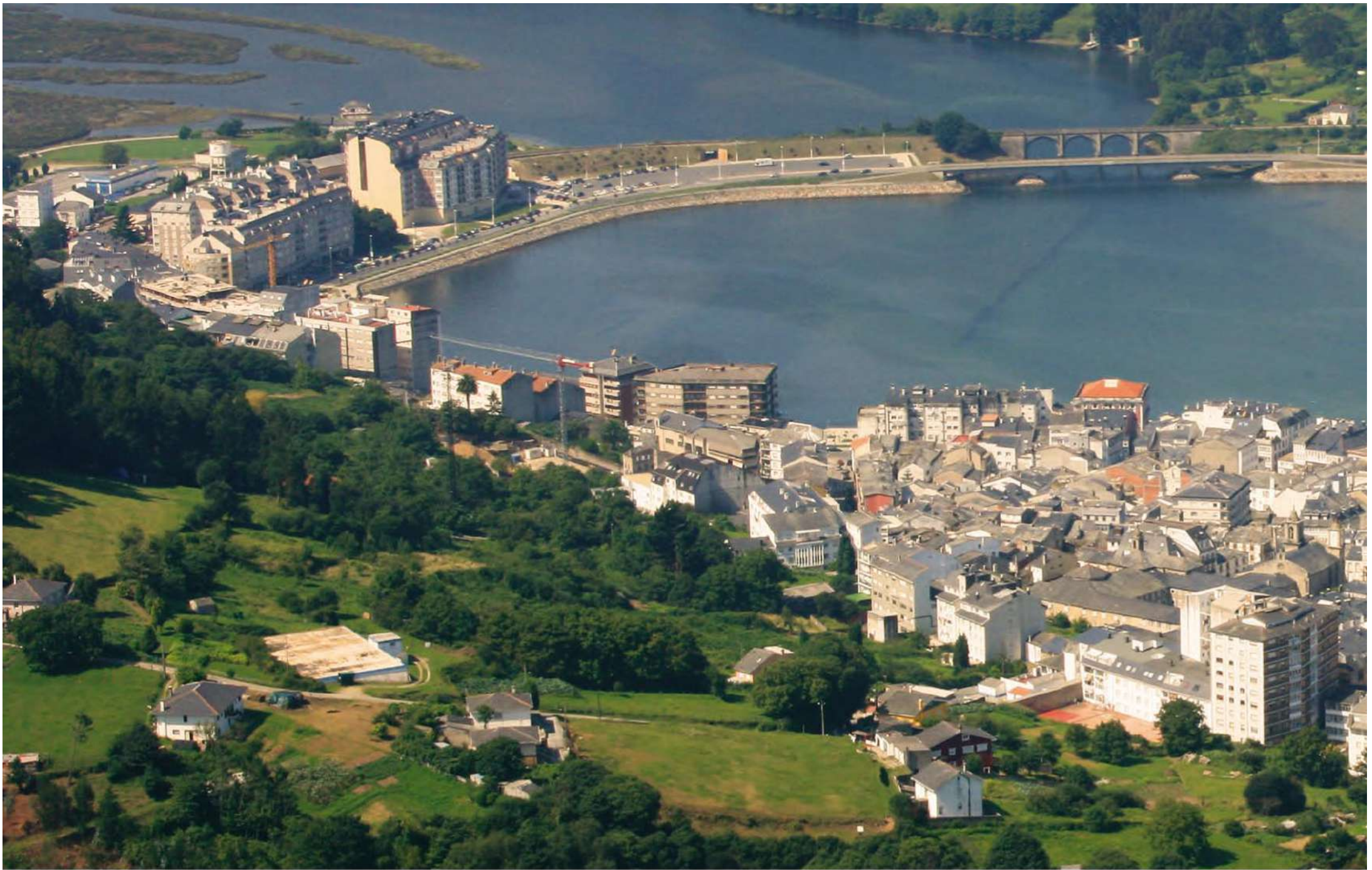
Vista de Viveiro