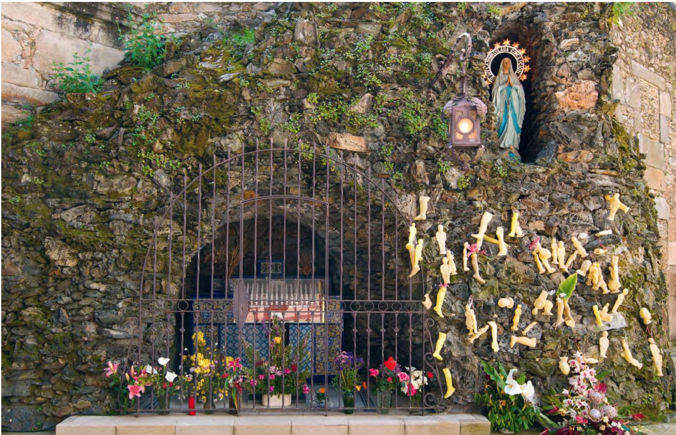
Capela da Virxe de Lourdes. Viveiro