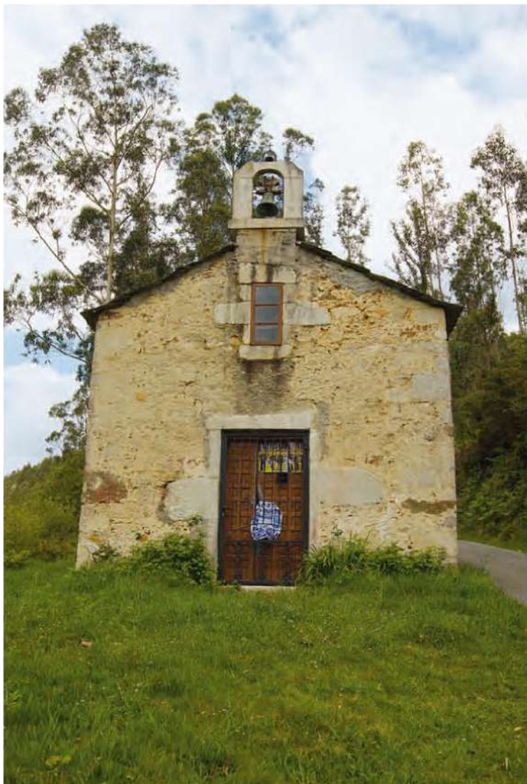
▲ Capela das Angustias ▶ Vista do Vicedo