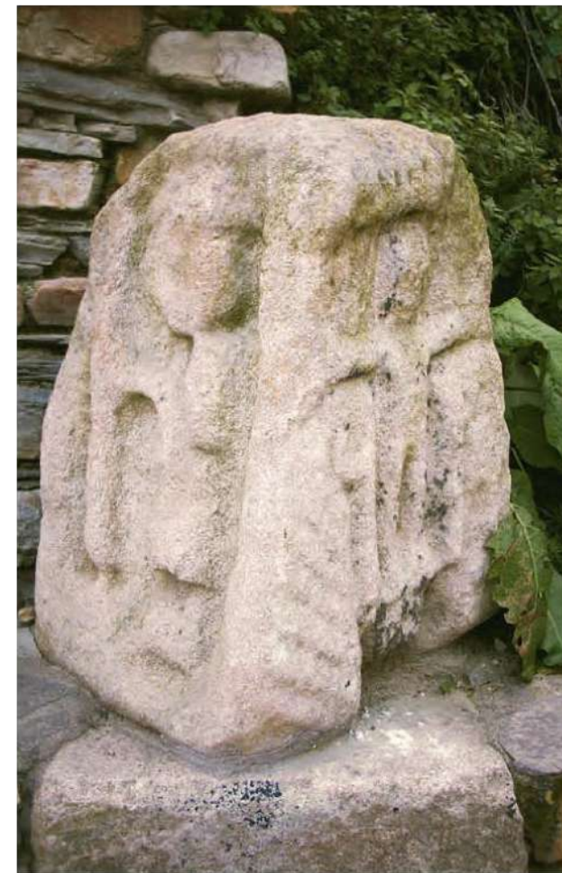
▲ Pedrada Ponte Vella, Fazouro