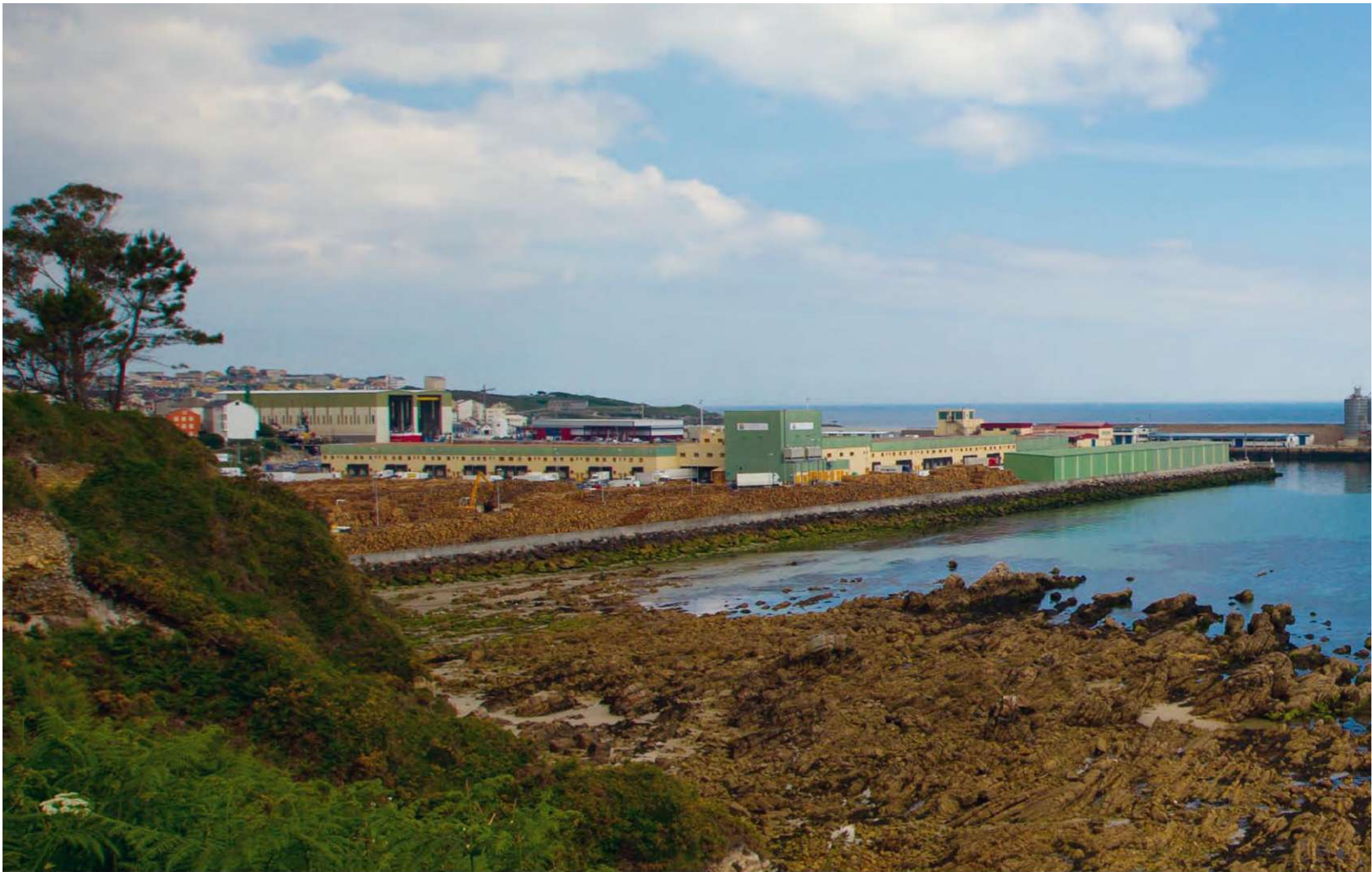
Vista de Burela