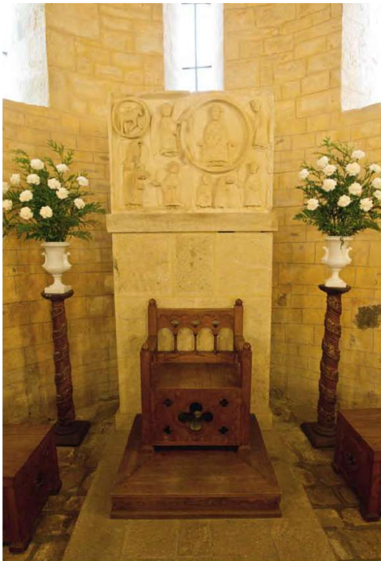
▲ Antependio ▶ Detalles do capitel interior

Cuberto por estes arcos vemos algo bastante pouco común na arte románica galega, trátase dun lintel pentagonal apoiado nas xambas cun crismón (símbolo de Cristo) pechado nun círculo no seu centro. Estes linteis chegaron a Galicia a través das peregrinacións xacobeas espallándose polo noso país dende Santiago de Compostela. Sobre do lintel vemos outro círculo con catro lóbulos que pecha dentro de si un Agnus Dei, cuxa representación é moi similar á empregada polo taller do Mestre Mateo en Compostela, aínda que a de San Martiño foi realizada con anterioridade.