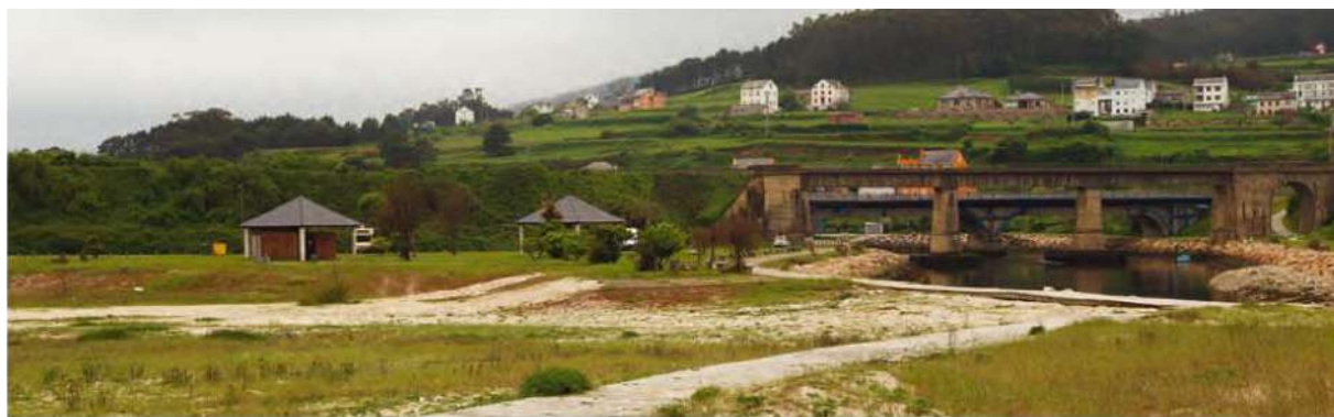
Praia da Pampillosa

dereita, pola rúa Congostra do Cura , cando remata atopámonos cunha bifurcación, debemos de coller á da esquerda que sube, rúa Otero Pedraio, que nos leva ata a glosieta de Vilalba.