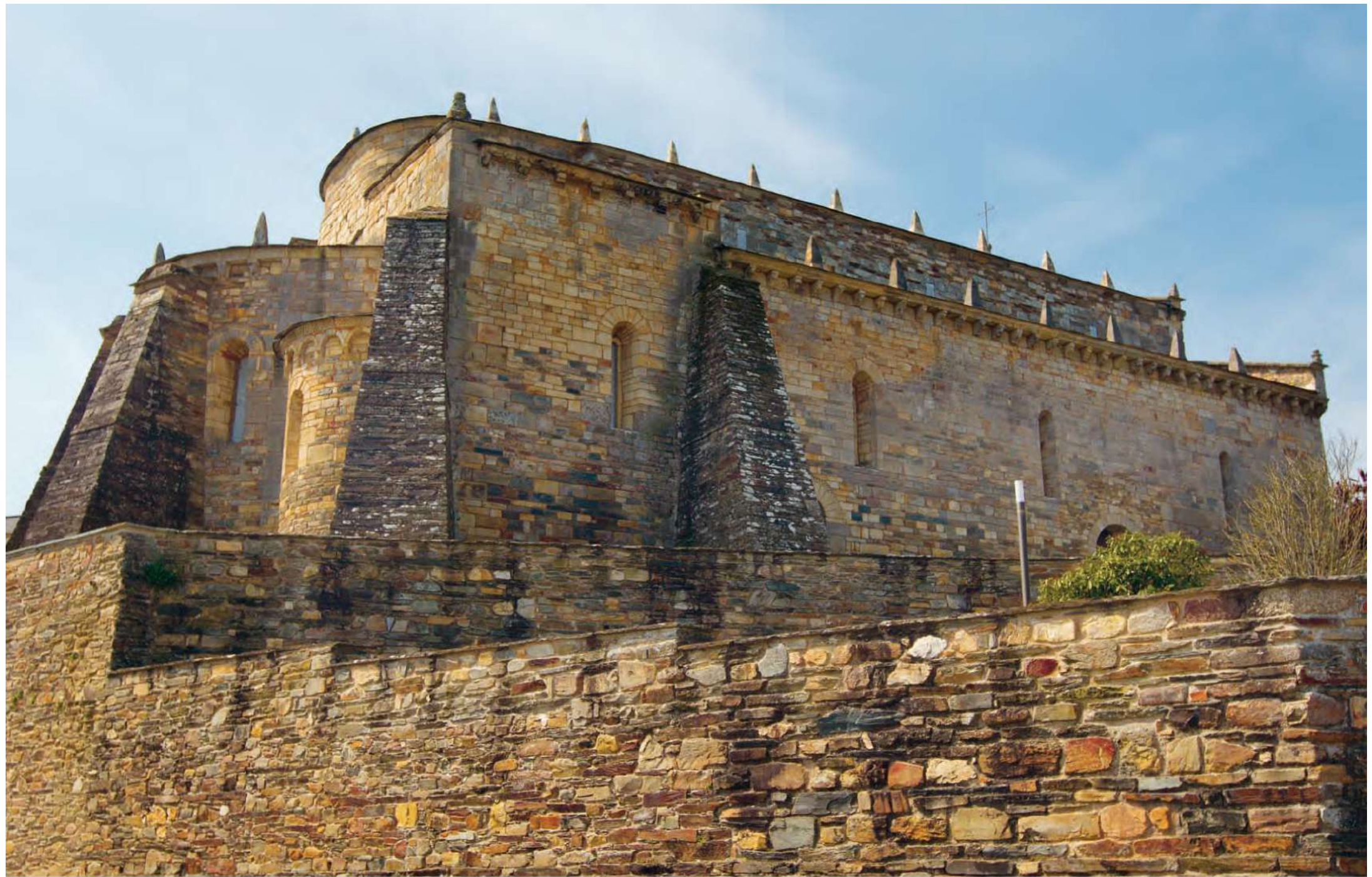
Basílica de San Martiño