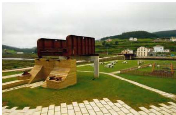
Ponte Vella de Fazouro e área recreativa