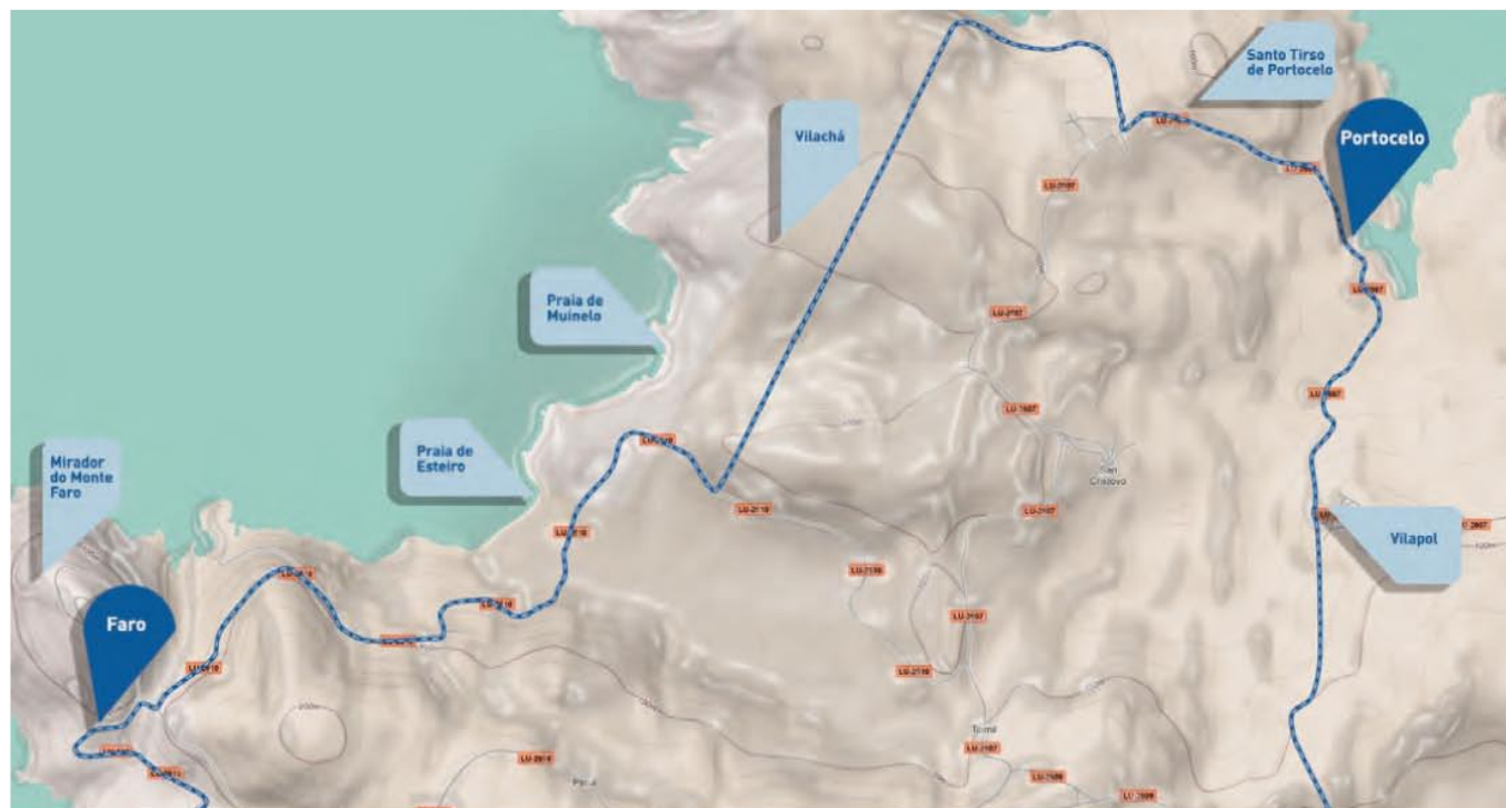
▲ Mapa trazado Portocelo-Faro

Seguimos na LU-2610, pasamos o punto quilométrico 5 para comezar a descender. Nese mesmo intre observamos a igrexa de Faro á nosa dereita. Un quilómetro despois estamos en Reboredo, onde recomendamos visita-las escavacións arqueolóxicas da vila medieval de Area e o seu areal. (23.8 km dende o Cruceiro de Cervo)