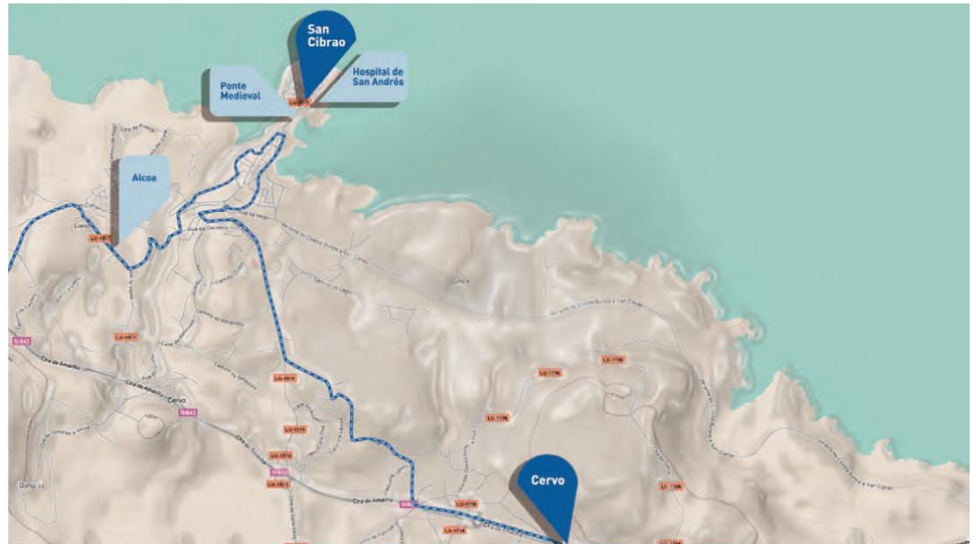
▲ Mapa trazado Cervo-San Cibrao

Comezamos no cruceiro e seguimos pola beirarrúa ata un cruce a 300 metros, cruzámo-la estrada nacional ata un camiño de terra que vemos xusto enfronte que nos leva despois dun quilómetro de percorrido, ata un transformador eléctrico que queda á nosa esquerda. Atopámonos nun cruce de camiños e collemos de fronte cara unha casa branca, pasamos por outra casa chamada Villa Soledad e collemos o primeiro desvío á esquerda ata máis adiante outra vez tomar á esquerda. Aínda non levamos percorridos 100 metros cando vemos un pequeno transformador que pon As Patosas , pegado a el hai un camiño de terra que nos vai levar ata a urbanización de Río Cobo , en concreto sairemos na Calle 4 . Á nosa esquerda está o clube deportivo e á dereita un parque. Na primeira intersección tomaremos á dereita, de igual maneira faremos na seguinte, estamos agora na rúa Calle 1 , descendemos ata a estrada que vai cara San Cibrao, este cruce coñécese como a Cruz de Maximino .